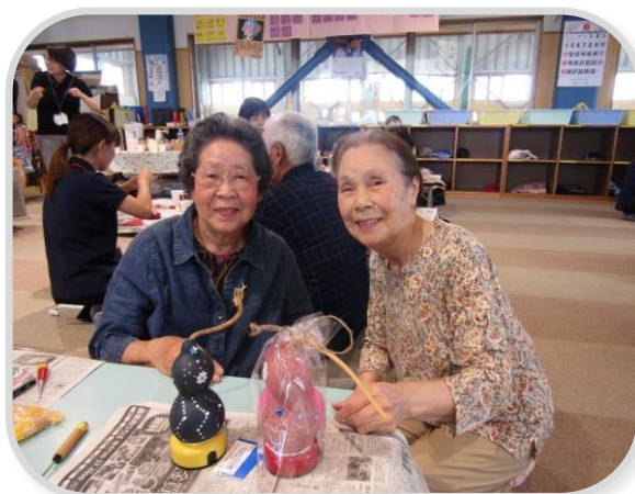
素敵に仕上がりました

思い思いに下絵を描き、黙々と穴を開けて、素敵なひょうたんランプが完成しました。製作中は真剣な表情でしたが、出来上がってランプを点けてみると、みなさんの笑顔がランプで輝いていました。