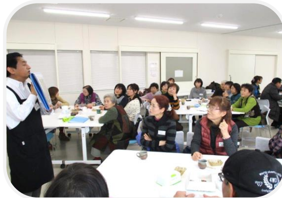
コーヒーって奥が深いねー