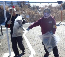
※写真は昨年度の様子です。

町内の美化作業のボランティア活動を通して町民と町内関係者との交流や、地域で支え合う仕組み作りの一助とするため、ごみ拾いを行います。