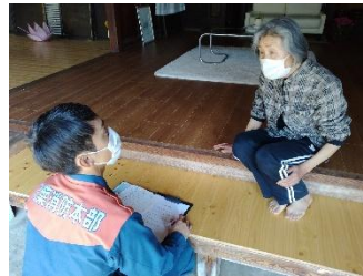
※写真は昨年度の様子です。