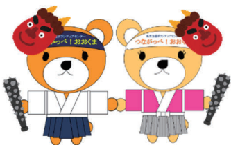
大熊社協マスコットキャラクター くまベえ くまベえの彼女

今年度最後のおおくまDEサロンは3月5日（木）に開催されます。どなたでも参加可能です！お待ちしております。