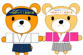
大熊社協マスコットキャラクター くまべえ くまべえの彼女

3月11日(水)大熊町役場前広場にて「3.11のつどい」がおおくままち3.11つどい有志の会主催、大熊町共催にて開催されました。東日本大震災そして、原発事故関連により亡くなられた方々、避難を余儀なくされ亡くなられた方々へ哀悼の意を捧げると共に、防災・減災への決意を新たにしました。本会職員も願いを込めた折り鶴の協力をしました。当時の想いを胸に、今後も皆様に寄り添った支援を行って参ります。