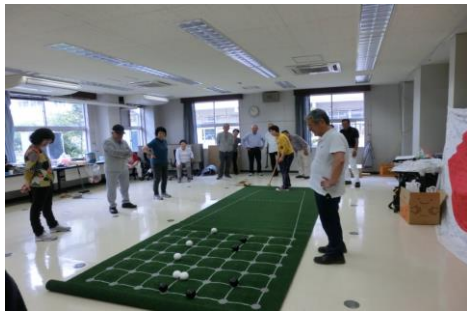
ねらいを定めて高得点！

6月20日（水）大熊町役場会津若松出張所内で老人クラブ連合会による会津地区ニュースポーツ大会が開催されました。