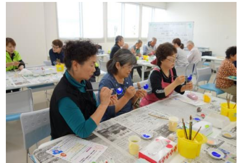
筆使いがお見事です！！

小さいだるまに集中して絵付けする姿は、真剣そのもの！！「手が震えちゃう。」「難しい」と言いながらも、色とりどりの個性あふれるステキなだるまが完成しました。