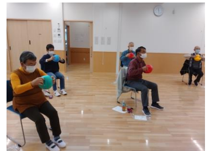
生活支援相談員事業： 地域交流サロン事業