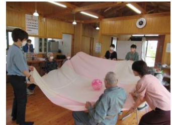
生活支援相談員事業： 地域交流サロン事業