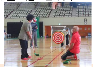
交流会等事業：ミニ運動会