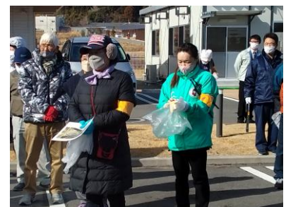
生活支援ボランティア事業： クリーンアップ