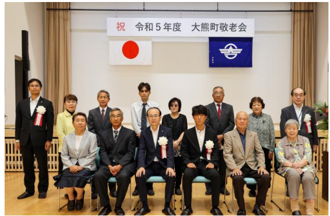
令和5年度金婚夫婦被表彰者名簿(敬称略)

当日は受彰者の中から5組の方が出席され、福島民報社、老人クラブ連合会及び社会福祉協議会から賞状と記念品が贈られました。