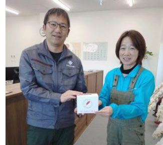
F' S FACTORY 様