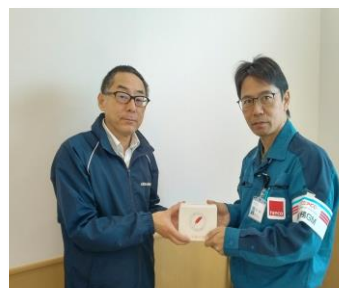
東京電力ホールディングス 様