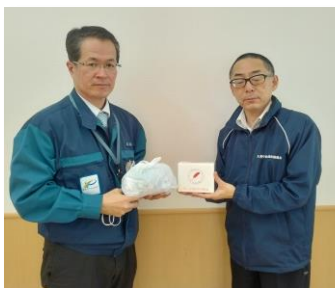
東京パワーテクノロジー 様