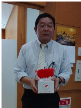
おおくままちづくり公社 様