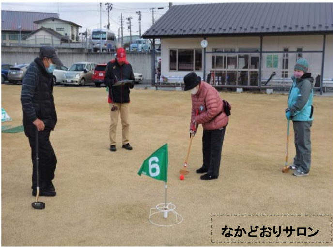
なかどおりサロン