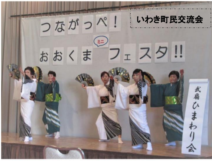
いわき町民交流会