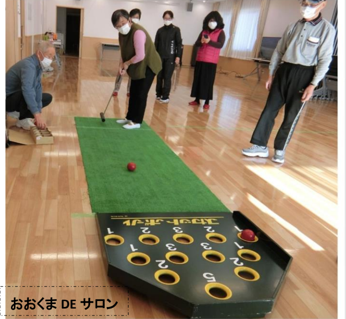
おおくま DE サロン