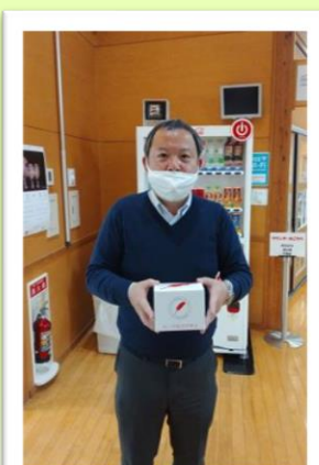
おおくままちづくり公社様