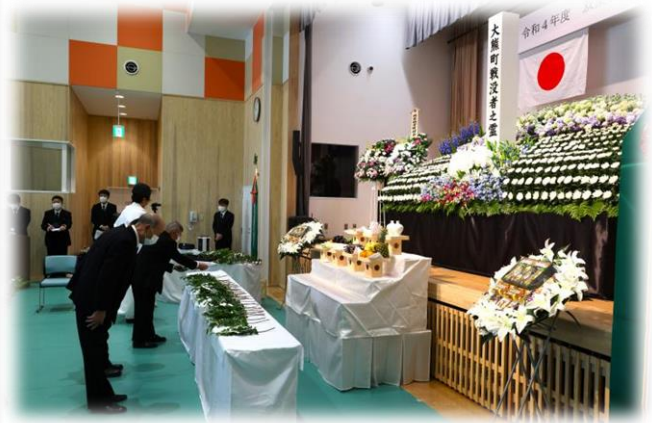
10月 戦没者追悼式慰霊祭