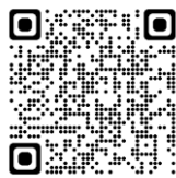
8月3日からの大雨災害義援金

※税制上の取扱いや特定の被災地への直接の寄付については、日本赤十字社内のページも併せてご確認ください。