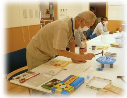
令和4年7月テーブルゲーム