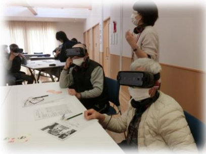
令和3年12月VR認知症体験会