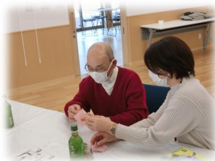
令和4年1月折り紙で脳トレ